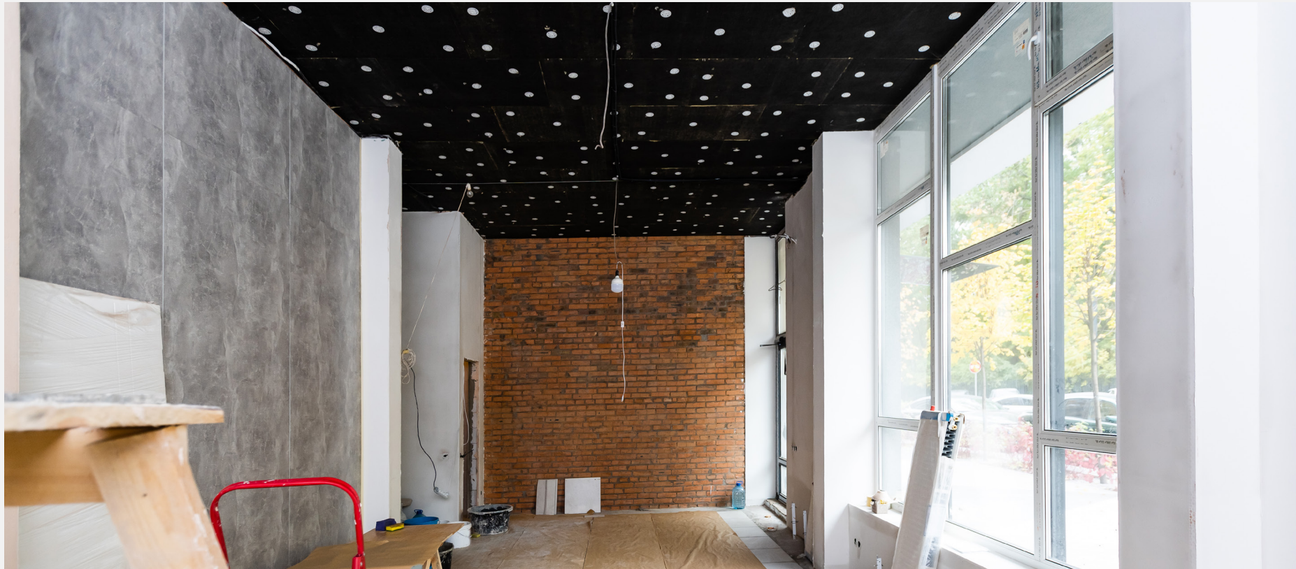
Diseño y remodelación de espacios comerciales